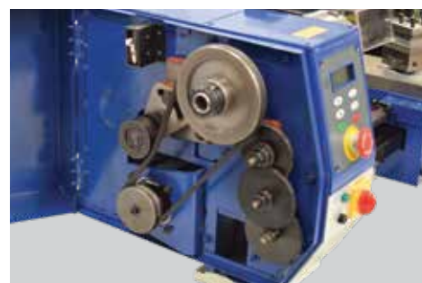
Detalhe da caixa de engrenagens