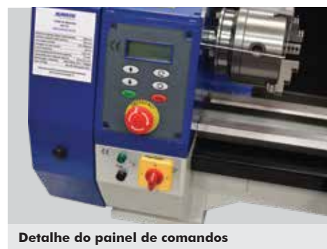
Detalhe do painel de comandos