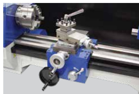
Detalhe do carro móvel